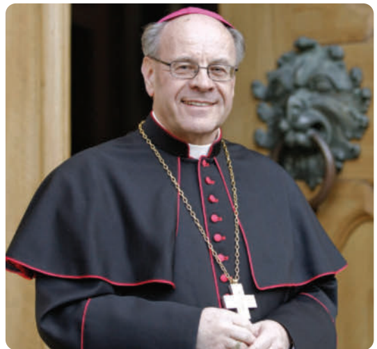
Vitus Huonder (1942-2024)