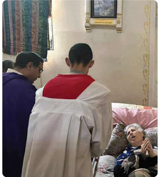
Seelsorge unter prekären Verhältnissen: Eine Frau in Gaza empfängt die Krankenkommunion

Die palästinensischen Autonomiegebiete gehören mit Israel, Zypern und Jordanien zum Lateinischen Patriarchat von Jerusalem. Bischof ist seit Oktober 2020 der Franziskaner Pierbattista Pizzaballa. Papst Franziskus nahm ihn im September 2023 ins Kardinalskollegium auf. Pizzaballas Titelkirche (=Pfarrkirche in Rom, die jeder Kardinal ehrenhalber erhält) ist Sant'Onofrio al Gianicolo. Informationen zum Patriarchat und zur Pfarrei «Holy Family» in Gaza gibt es unter www.lpj.org .