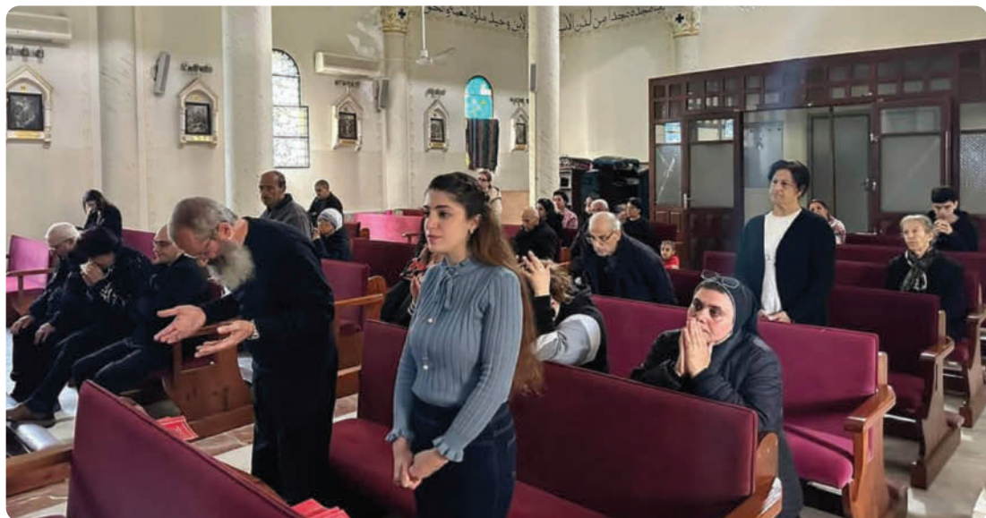
Christen lassen es sich trotz allem nicht nehmen, in der Pfarrkirche regelmässig zur Messe zusammenzukommen